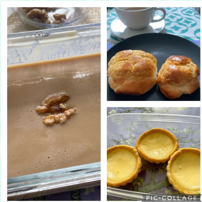
同工們送上的愛心菠蘿包、 愛心蛋撻及愛心合桃露