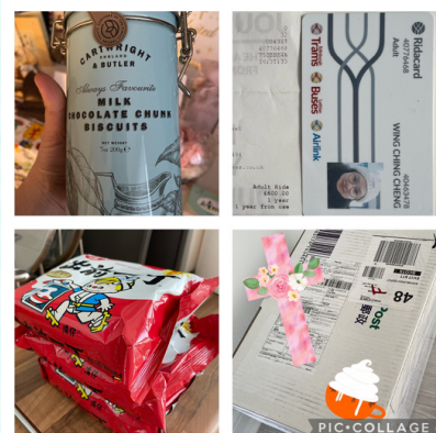
信中提及種種的恩典和供應

因物價上升，又不像香港那樣方便買外賣或外出用膳。到埗已經差不多8個月的時間，的確必須每月計算來分配並善用資源，。但是到今天，耶和華是我的牧者，在這宣教旅程上，我一無所缺！天父不時藉著那記念我的肢體們給予我恩典，從他們中收到一些額外支援。有肢體對我強烈表示：「這心意是給你買一些好東西或外出吃一頓豐富的！！」也會不時聽見門鐘響起，收到從香港或其他地區寄來的愛心包裹，小小的心意例如一幅麵包超人揮春、一對冬天用的手套、一本繪本書籍或一罐曲奇，甚至是令我驚喜的「出前一丁」，這些心意我都珍而重之，感謝各位遠方和近處給我的溫暖和支持！