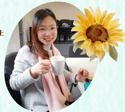
參與本地教會舉辦的港人 (英語)查經小組(外展佈道)

今次，得牧者的鼓勵，就讓我存感恩、誠實和樂意獻上的心，與各位分享生活點滴和互勉！