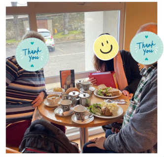
與本地教會兒童主日學校 校長夫婦交流