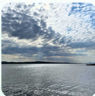
路上喜見耶穌光 -信心與盼望-