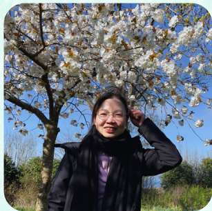
與患病主內肢體 到公園賞櫻

“你當剛強壯膽……耶和華必在你前面行。祂必與你同在，必不撇下你，也不丟棄你。不要懼怕，也不要驚惶。”申命記 31:6-8