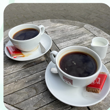
與羅馬尼亞姊妹 Coffee time 分享信仰及家庭經歷