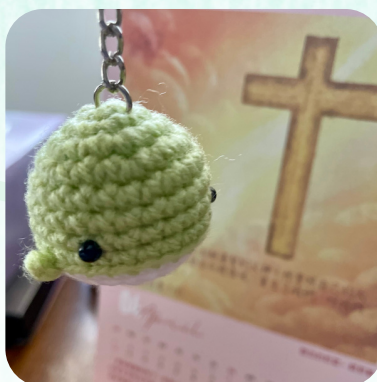
4月2日到格拉斯哥 證道後的小禮物