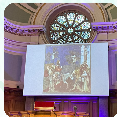
復活節參與本地教會聚會