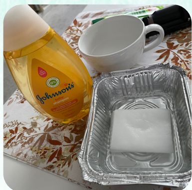
感謝主醫治眼睛情況