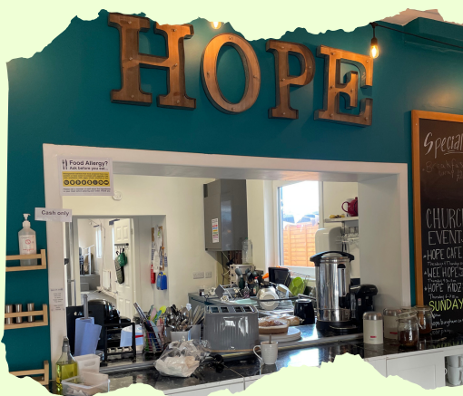
接觸不同地區教會牧者領袖

而我即將同步開展第三個事奉崗位，就是到愛丁堡基督教華人教會 (ECCC) 協助堂會兒童事工發展及培訓需要，將於 3 月至 4 月期間到堂會進行深入了解和分析，與領袖同工商討支援方案後，便展開具體計劃，願主親自與眾人同工，建立教會！