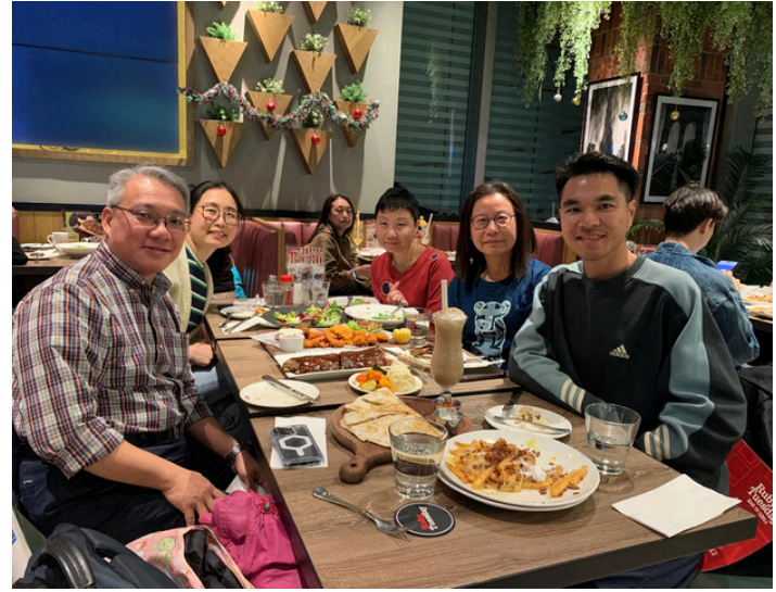
與福泉堂差傳部聚餐