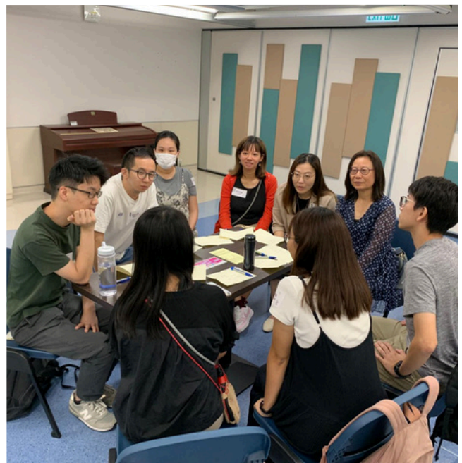
參加三宗的研究會