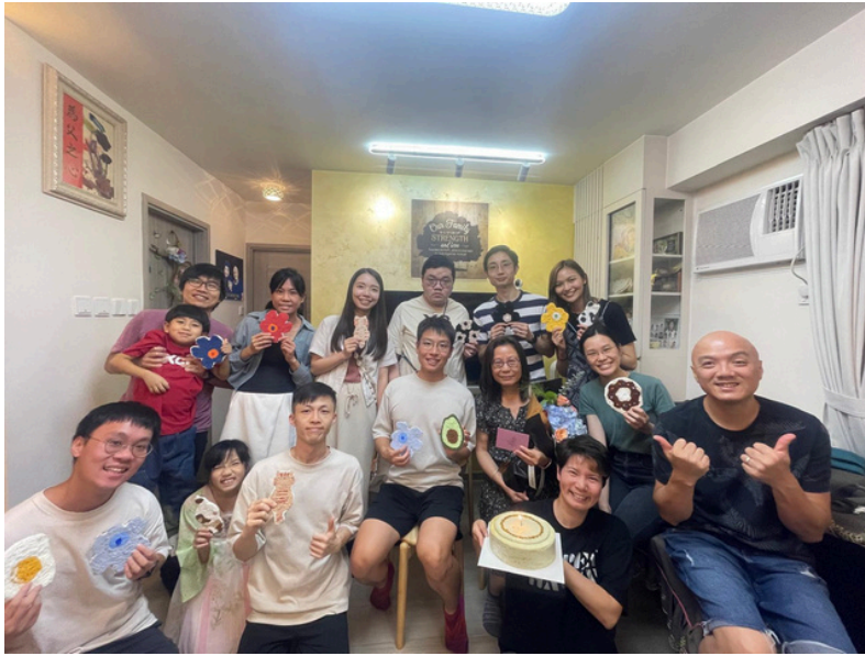
樂泉青崇給我的驚喜生日派對🎂