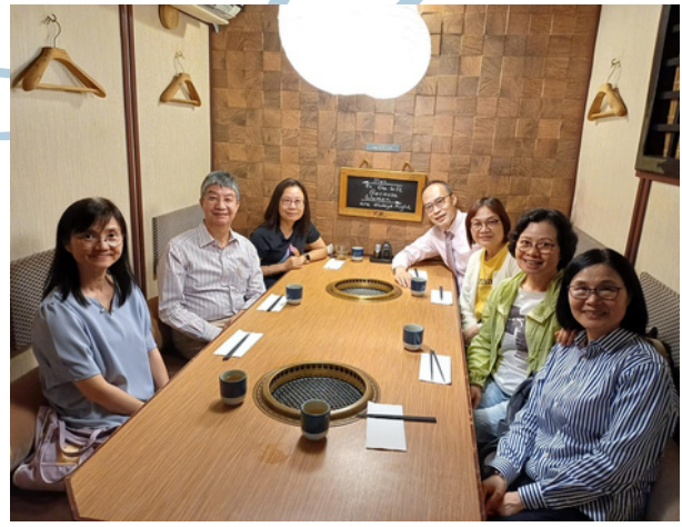
與恩泉堂差傳部聚餐

在圖作短期服侍的傳道人，她在12月中也要離開，謝謝她對小組的幫忙及照顧。她也在尋求下一個工場，求主也帶領她走前面的路，找到適合的工場。而小組暫時亦能維持主日崇拜，星期五的查經班，也邀請了一位傳道人幫忙，期盼組員能積極參與，有渴慕神話語的心。