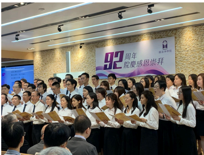
播道神學院92週年院慶