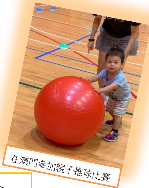
在澳門參加親子推球比賽