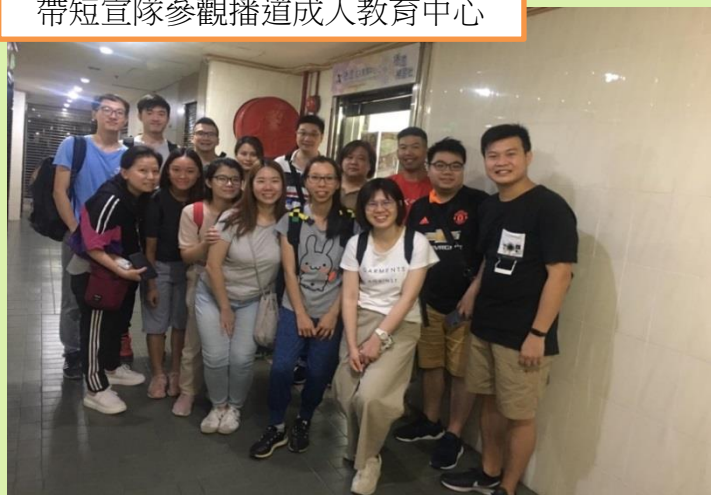
帶短宣隊參觀播道成人教育中心

最後，感謝神的恩典和供應，神不單感動我們一家到前線宣教，也感動一群支持者在背後支持我們。現我們的籌募進度已接近80%，只待工作證簽發後我們便能動身前往澳門工場。因此，我們將於 2020年2月2日(日)下午3時於播道神學院 美孚新校舍的禮堂舉行 宣教士差遣禮，誠邀各位屆時抽空出席。感謝神讓我們一家有你們的同行。