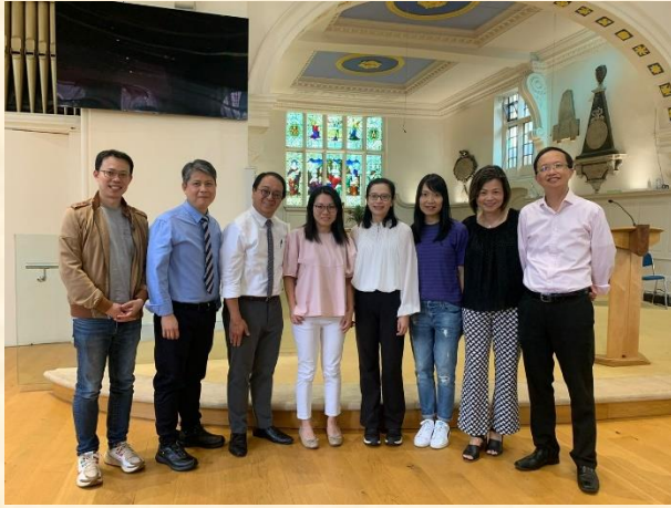
同工探訪諾定咸華人基督教會和教牧領袖合照