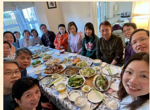
一年一度團隊及家屬實體歡聚

感恩同工一致贊同培訓中心的團隊是「夢幻組合」(Dream Team)，我們人手雖然短少，但是卻非常同心，每論董事、同工或義工，都委身事主，合作愉快！