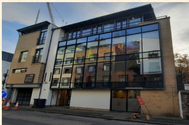
培訓中心計劃購買之物業

在此報告培訓中心計劃購買物業作校址的進展，自從發出籌款的呼籲，收到很多主內肢體和教會的積極回應，令我們十分感動。截至七月中，除了基金會答允支持的配對基金一百萬英鎊外，我們籌得二十四萬英鎊，總數共一百二十四萬英鎊(約港幣一千二百四十萬元)，距離整個項目的目標尚欠九十六萬英鎊(約港幣九百六十萬元)。為著弟兄姊妹無私的奉獻，我們感謝讚美主，因為祂興起世界各地的肢體和教會與培訓中心同心發展英國的華人神學教育。物業的成交日期是八月底，距今只有一個多月，我們仍有不少手續需要處理，請為我們禱告，求主保守購買的過程，順利如期成交，謝謝！