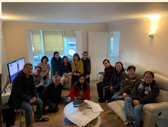
董事、同工、義工及配偶之合照