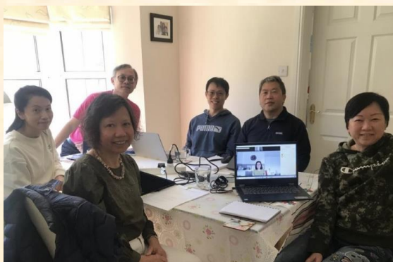
6月4日之董事會會議

英國炎夏已至，經過了兩年疫情的限制，人們都急不及待外出渡假，舒展身心。雖然確診數字仍然高企，如我身邊的朋友及我自己都紛紛染疫，但是大家都似乎習以為常，不再大驚小怪了。對培訓中心來說，我們盼望能走出單靠網上的聯繫，步向實體與網上雙軌的開會及上課模式。第一步是我們的董事會經過兩年網上開會後，於六月首次重新能實體開會。那天我們不但能更緊密交流，更能和同工、義工及配偶一同燒烤及相交，深化團隊精神，見面時雖未致於「彷彿隔世」，但卻有「久旱逢甘露」的感覺！