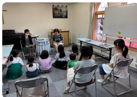
每週2次的兒童福音性英文會話班