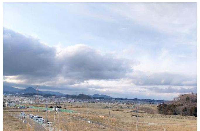
泉教會附近的富谷市所有森林山區全部被夷為平地、建了很多新的房屋和有很多新的家庭遷入。