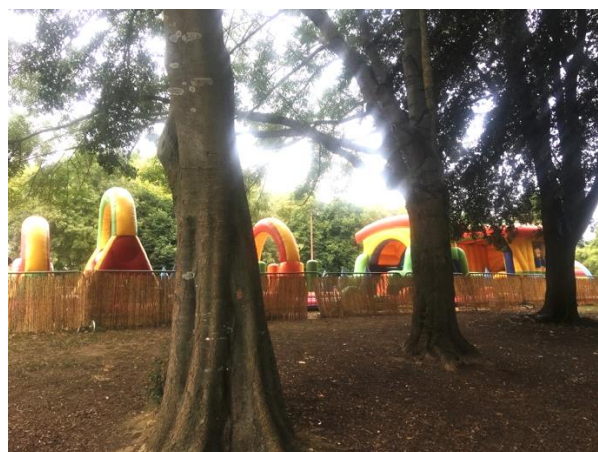
*在加龍 (Garonne) 河畔裝置了不同的兒童遊樂設施，免費供一家大小玩樂

八月份這裡正舉行一年一度的河邊活動，我們趁此機會招聚太太們一起共渡歡樂時光。這些太太大都是嫁給法國或外國人，孩子是混血兒。她們沒有家人在身旁，又要面對文化衝擊和各種挑戰，我們藉著活動提供了機會給她們休息、分享、釋放情緒。