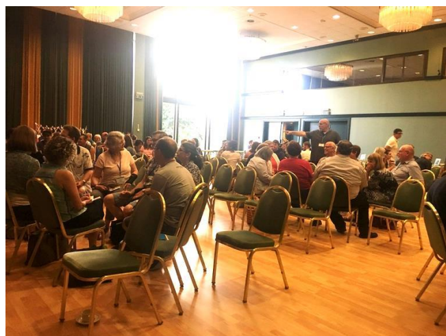
*聽完差會的異象及文化介紹後，是分組討論

透過當中的敬拜、信息、遊戲、介紹、工作坊等，令我對差會和領導團隊有更多的認識，得到很多的啟發。